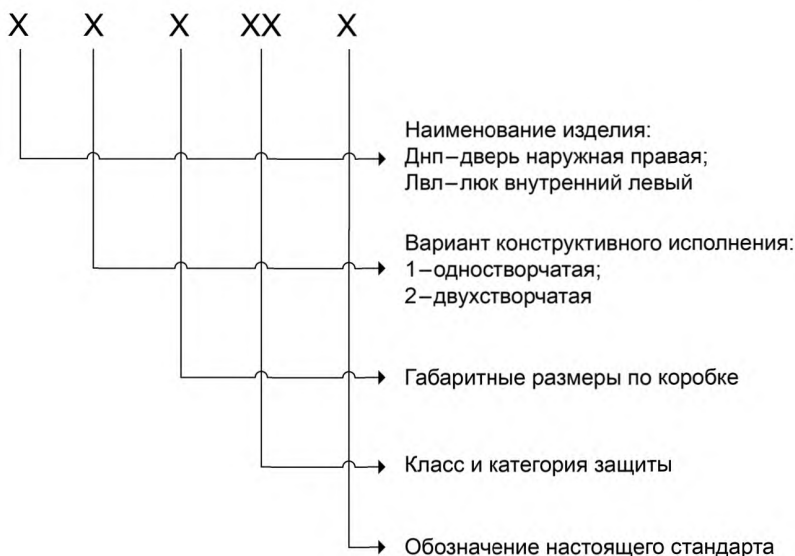
Примеры условного обозначения

4.3.2 Устанавливают следующую структуру условных обозначений ВЗК в документации при оформлении заказа.